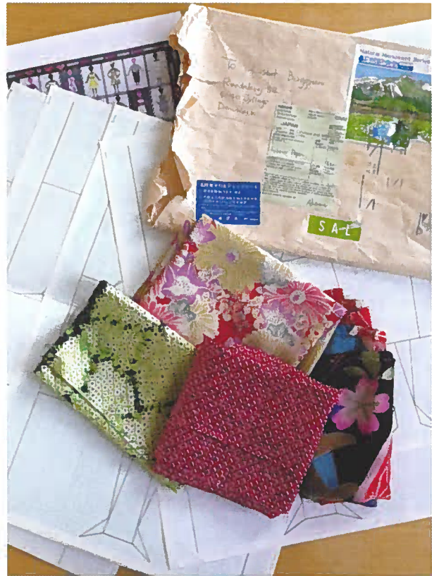
Den brune kuvert fra Japan indeholdt udover små skønne stoffer også tegninger, vi kunne sy efter.

Der blev delt 42 kits ud, og vi er pt. 54 medlemmer, så ikke alle er med i projektet, men 42 er virkelig mange.