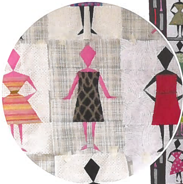
Medlemsmøde. Udsnit fra første prøveopsætning af damerne.